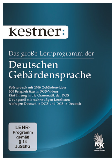
Seit Jahren das Standardwerk der Gebärdensprachlernenden

Dass die Videos an beliebigen Stellen gestoppt werden können, ist nicht neu. Praktisch ist der farbig anpassbare Malstift, um weitere Informationen (Pfeile, Richtung etc.) einzufügen. Die Bilder lassen sich farbig oder schwarz-weiß kopieren. Den blauen Hintergrund kann man mit dem Freistellungsregler auf Weiß umschalten. Das fertig bearbeitete Bild lässt sich danach kopieren und in fast jedes Dokument einfügen. Praktisch ist die Erstellung einer Druckseite als Arbeitsmaterial für Kursteilnehmer. Mit wenigen Mausklicks lassen sich bis zu sechs Vokabeln auf dieser Seite einsetzen.