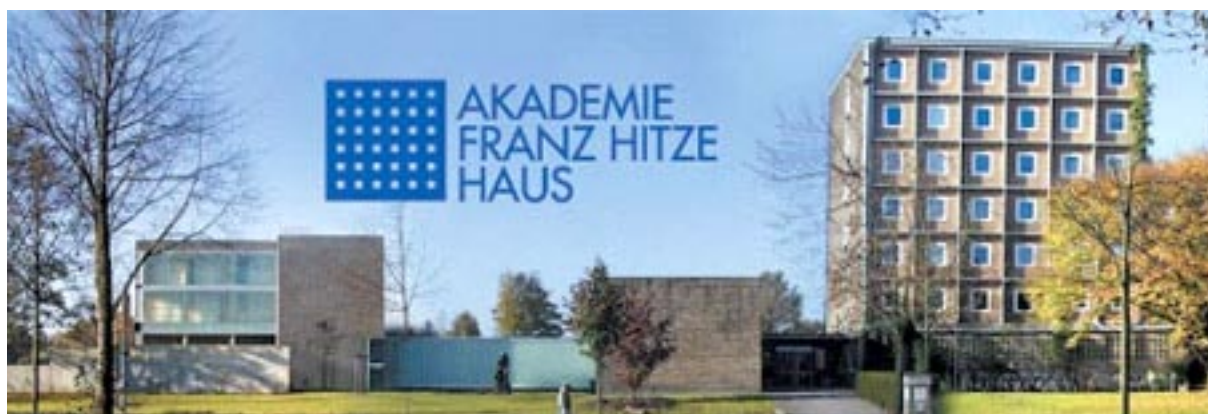
Das Franz-Hitze-Haus in Münster ist unser Tagungshaus in diesem Jahr ( www.franz-hitze-haus.de ).